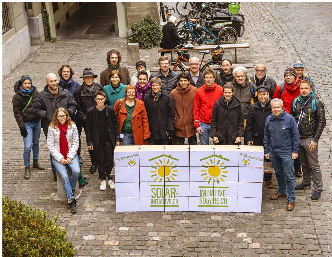
Die Solar-Initiative wurde am 17.11.2021 mit 18696 Unterschriften eingereicht.